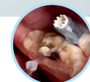
Maximat Plus Matrizenspannsystem

Besuchen Sie uns! www.polydentia.ch/de/vista-tec