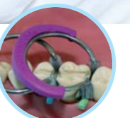
Quickmat Deluxe Teilmatrizensystem