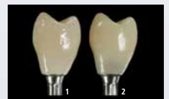
Hybrid-Abutment-Krone verklebt mit Multilink Hybrid Abutment HO 0 (1) und einem Befestigungsmaterial normaler Opazität (2)