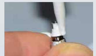
Applikation von Multilink Hybrid Abutment auf die Titanbasis