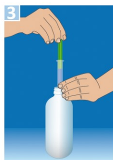
gewünschtes Volumen aufziehen